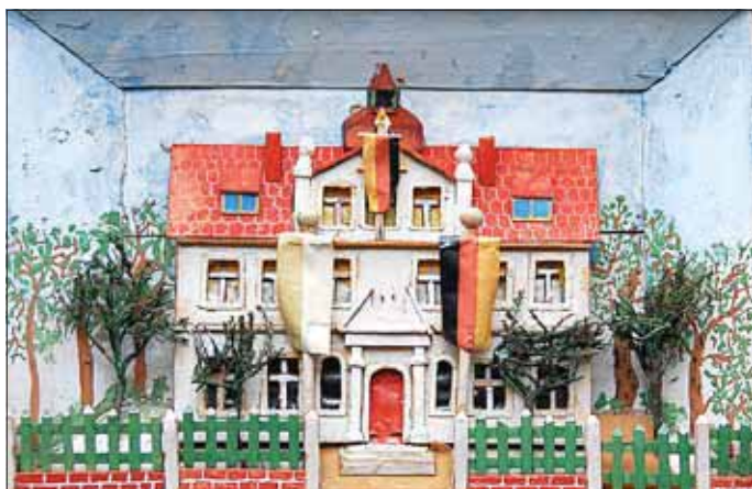
Die Maxener Schule als Diorama-Bild – Foto: Michael Simon