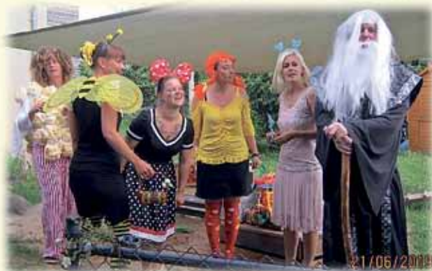
Theaterstück unserer Eltern zum Zuckertütenfest Die Kita „Am Fuchsbau“ in Krebs