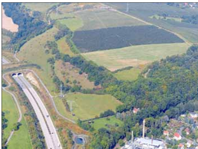
Eine große Herausforderung für den Naturschutz – FFH-Gebiet Meuschaer Höhe in unmittelbarer Nähe zur A17

Vom 3. bis zum 19. August präsentieren wir in einer Roll-Up-Ausstellung Wissenswertes rund um die länderübergreifende Naturschutzstrategie Natura 2000, die Aktivitäten dazu in unserem Landkreis und detaillierte Informationen zu acht ausgewählten FFH-Gebieten. Garniert sind die Fakten mit tollen Fotos schützenswerter Tier- und Pflanzenarten sowie deren Lebensräume. www.lpv-osterzgebirge.de