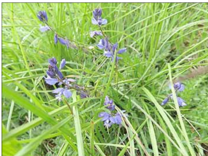
Kreuzblümchen ( Polygala vulgaris ) blühen meist blau im Mai bis August auf mageren Wiesen im Bereich der Meuschaer Höhe.