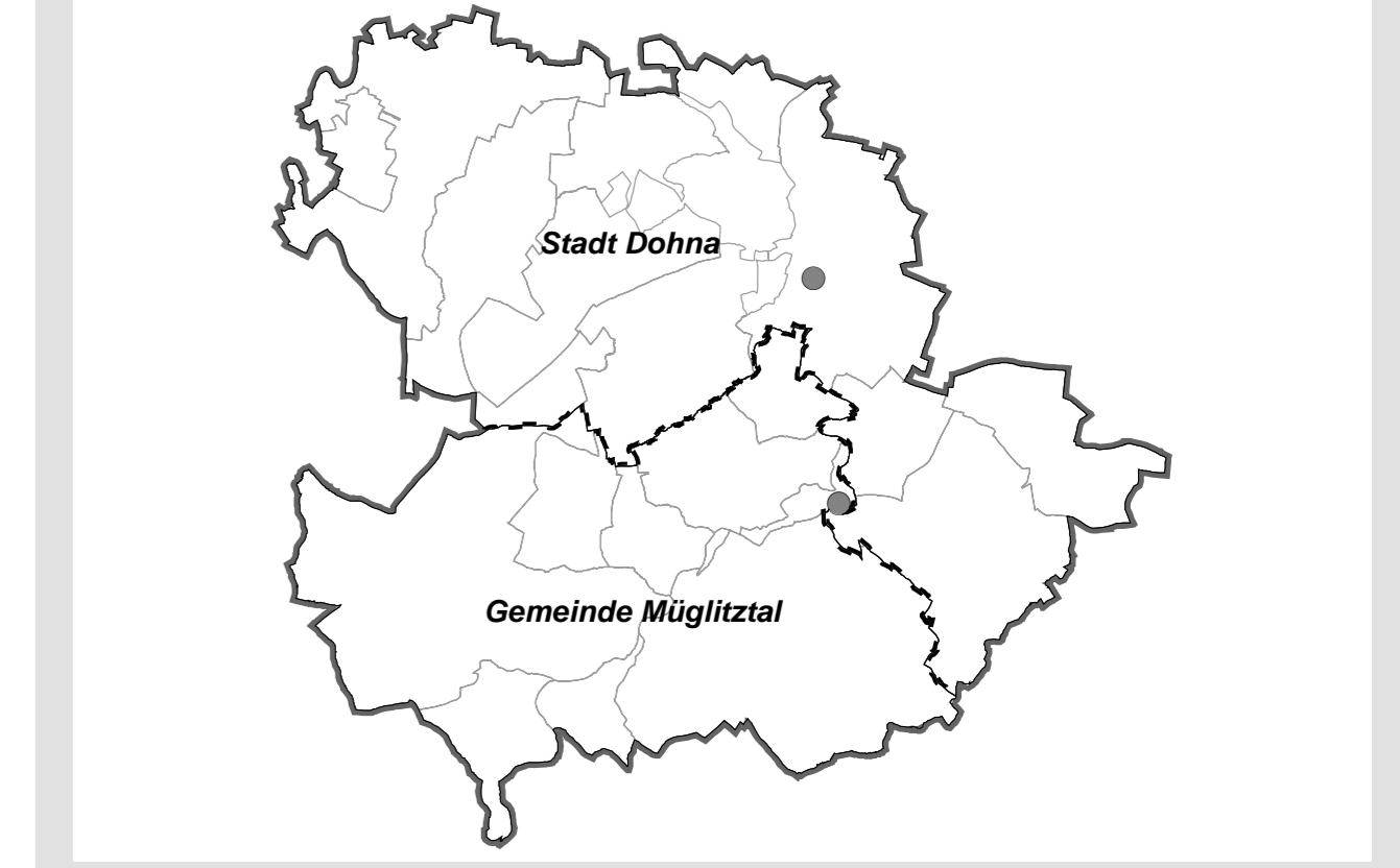
Übersichtskarte: Räumlicher Geltungsbereich des Landschaftsplans 1:85.000