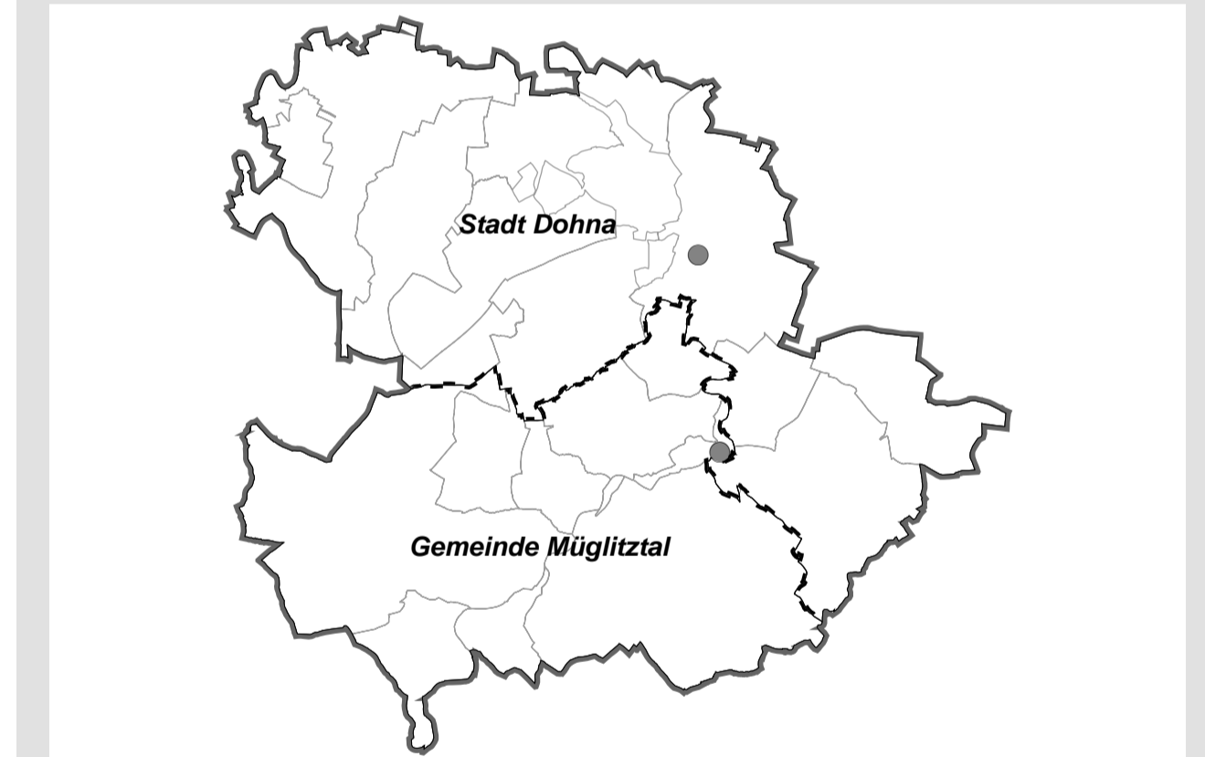
Übersichtskarte: Räumlicher Geltungsbereich des Landschaftsplans 1:85.000

Verwaltungsgemeinschaft Dohna-Müglitztal