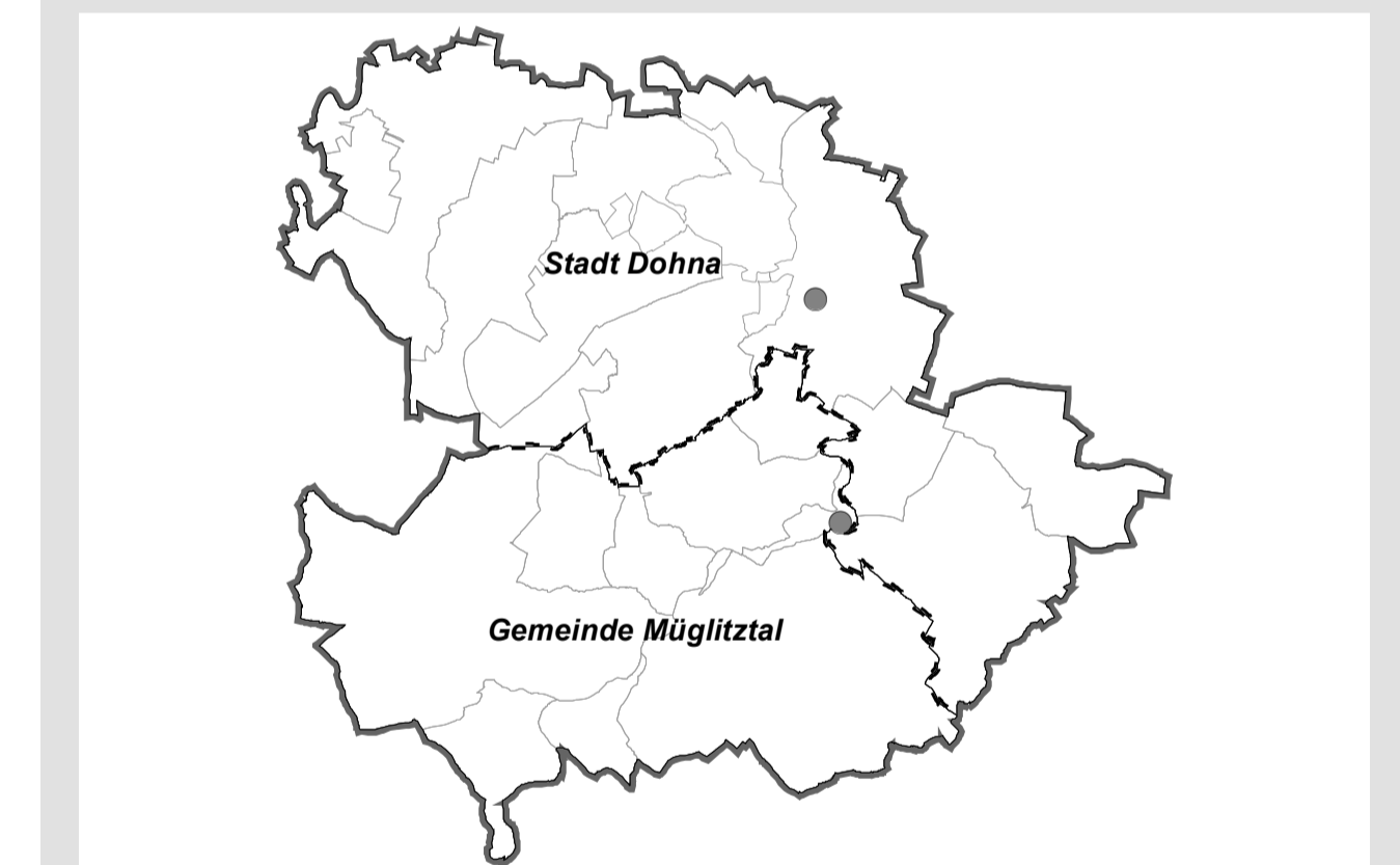
Übersichtskarte: Räumlicher Geltungsbereich des Landschaftsplans 1:85.000